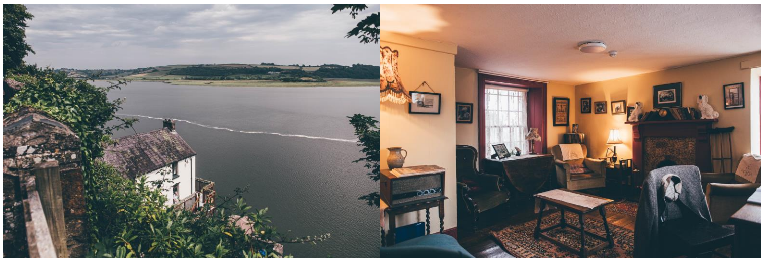
Lluniau o Gartref Dylan Thomas

Mae'r cynllun Grantiau Bach yn bosibl diolch i gyllid gan Lywodraeth Cymru drwy'r Aðran Ddiwylliant, a chymorth gan Ffederasiwn Amgueddfeydd ac Oriolau Celf Cymru.