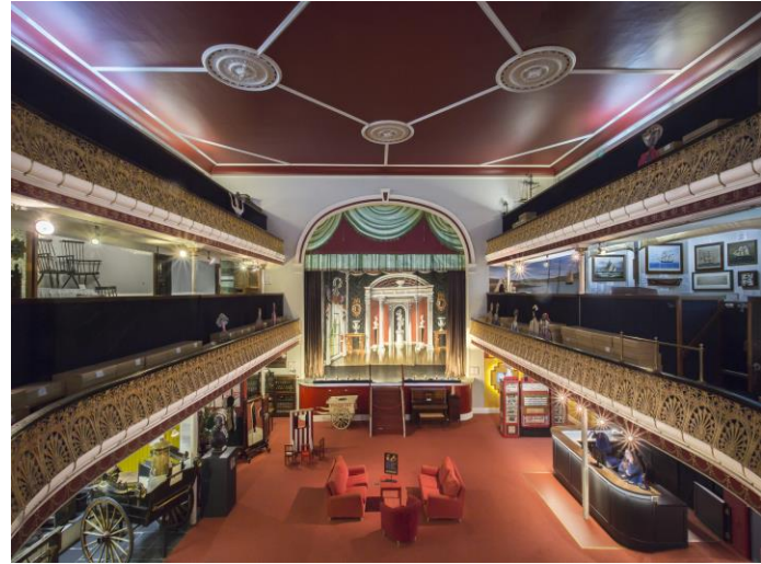
Tu mewn i Amgueddfa Ceredigion, caniatâd wedi ei roi gan Amgueddfa Ceredigion.

Oherwydd pwysau ariannol digynsail, roedd Cyngor Sir Ceredigion wedi gofyn i Amgueddfa Ceredigion ar chwilio'r opsiynau o symud i statws ymddiriedolaeth, gyda'r bwriad o gael gwared ar gyfrifoldeb llywodraethu a galluogi'r amgueddfa i weithredu'n nanni bynnol. Oherwydd y wybodaeth arbenigol sydd ei hangen i gynhyrchu astudiaeth ddichonoldeb dylwyr a realistig, ceisiwyd grant gan Ffederasiwn Amgueddfeydd Cymru i dalu am gostau ymgynghoriaeth broffesiynol i helpu'r amgueddfa ystyried yr holl opsiynau, a chlustnodi a chostio model a ffefrir.