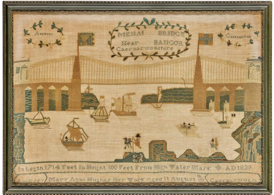
Llun 1: Sampler Pont y Borth.