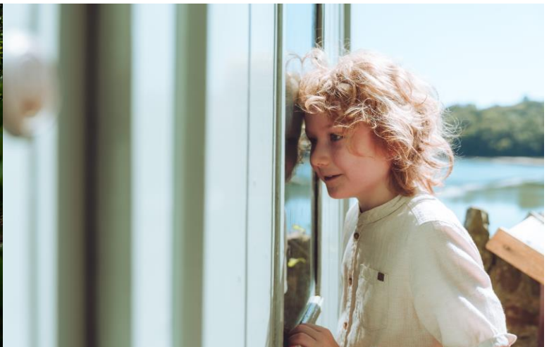
Lluniau o Gartref Dylan Thomas